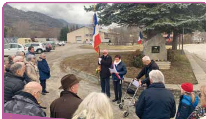
Commémoration du cessez-le-feu du 19 mars

Un très beau spectacle Asrâr de la Compagnie Litha, offert par la commune, a clôturé cette journée : jeux de feu, danses et poésie ont émerveillé un public venu nombreux. Une belle réussite !