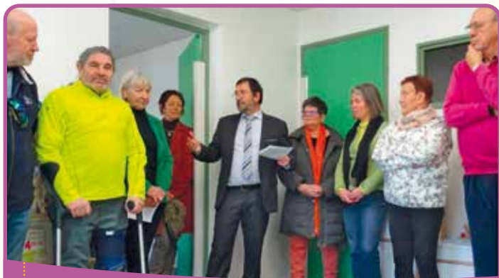
✿ Inauguration des locaux de l'ALSH

Les travaux dans l'ancienne trésorerie ayant été réalisés en 2022, ces locaux sont devenus un Accueil de Loisirs Sans Hébergement géré par l'ASCR de St-Jean-St-Nicolas, pour les enfants de 3 à 5 ans. L'inauguration des locaux a eu lieu en janvier 2023.