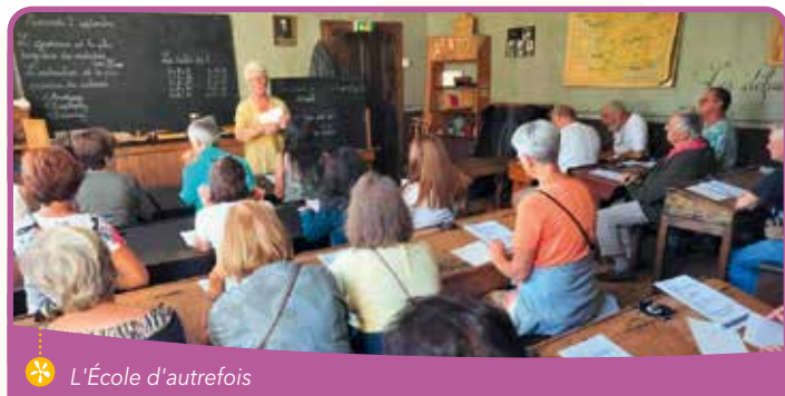
✿ L'École d'autrefois

« Faire revivre les traditions et conserver la mémoire du passé » tels sont les objectifs de l'Association du Musée du Moulin & de l'École d'Autrefois.