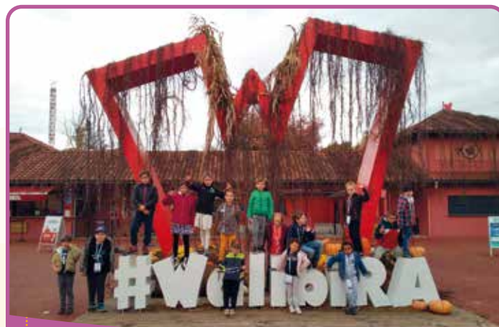
✿☀ Le centre aéré en voyage

Nous avons fait appel, à différentes occasions, à l'aide de la Municipalité, toujours à notre écoute, pour résoudre certains questionnements notamment au sujet de l'ALSH.