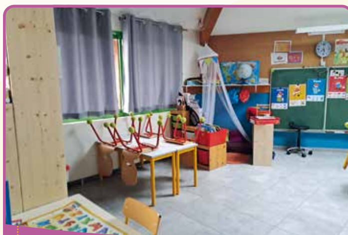
✿ La classe de Delphine