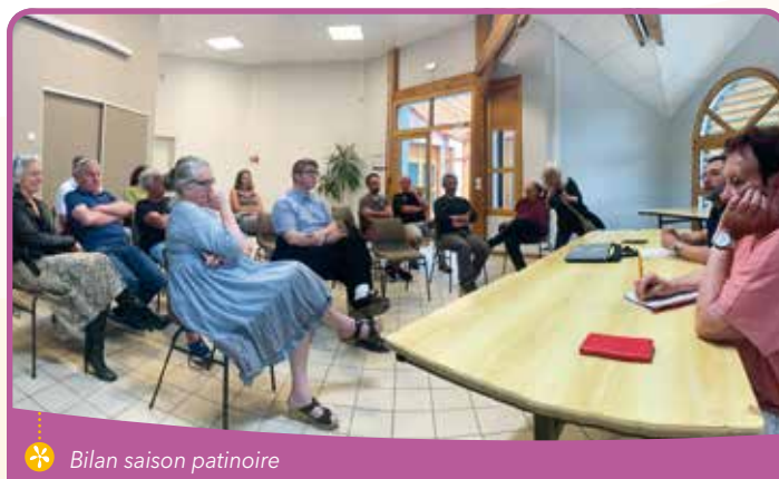
✿ Bilan saison patinoire

On sait désormais qu'il est possible de maintenir de la glace de manière naturelle, sur cette patinoire artificielle. L'expérimentation de janvier a permis de vérifier ce qui