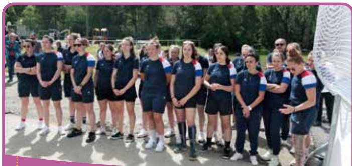
✿ L'équipe féminine championne de France

Profitant de la venue exceptionnelle de l'équipe de France féminine, championne du Monde 2021, le terrain de Roller Hockey de la base de loisirs du Châtelard a été inauguré.