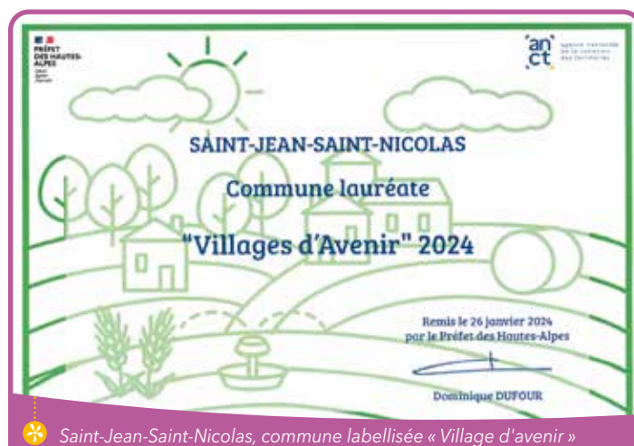
✿ Saint-Jean-Saint-Nicolas, commune labellisée « Village d'avenir »

Annoncé le 15 juin 2023 dans le cadre du plan France Ruralités, « Villages d'avenir » est un programme qui vise à accompagner des communes rurales de moins de 3500 habitants dans la réalisation de leurs projets de