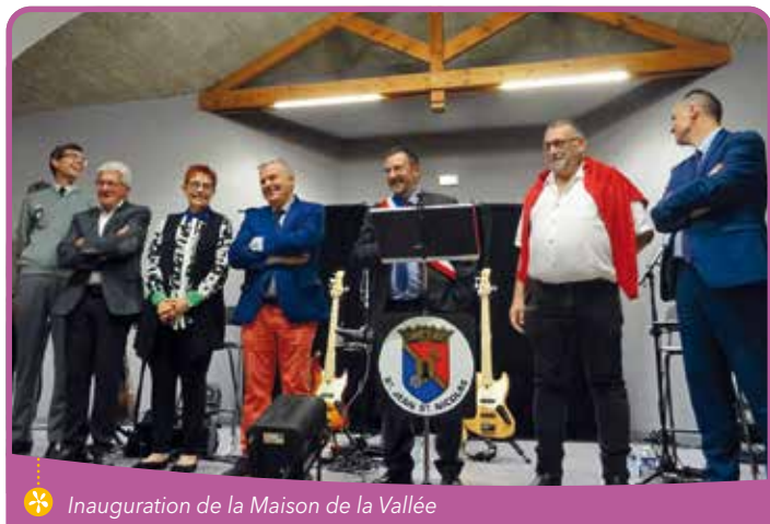
✿ Inauguration de la Maison de la Vallée

Après plusieurs reports de fin de chantier et de réception des derniers ouvrages, dont la véranda reliant la salle principale à la salle de réunion, côté Drac, fin juillet, l'inauguration officielle a eu lieu le 16 septembre 2023.