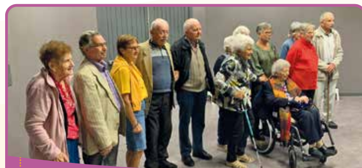
✿ Les 50 ans de la Chorale

Le 21 juin 1982, lors de la première fête de la musique,