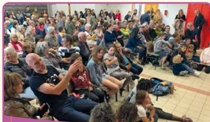
Le Jeu des Mille Euros