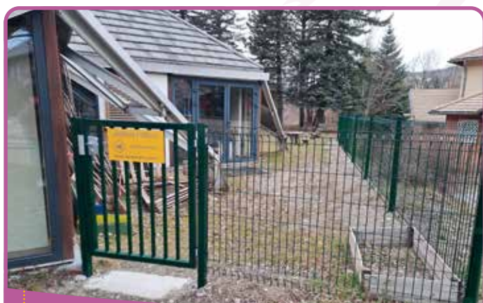
✿☀️ Le jardin public

Attention, les chiens ne sont pas admis dans cet espace qui doit rester propre !