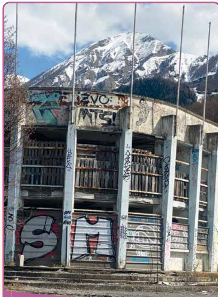
✿ La piscine du Haut Drac

Le 16 juillet 2021, une réunion est organisée entre les élus des 3 communes pour discuter de l'avenir de la piscine, suivi d'une réunion en Préfecture.