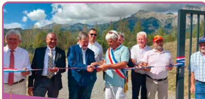
✿ Inauguration des ouvrages du captage de la nappe de Choulières

Pour mémoire, la commune de St-Jean-St-Nicolas a un droit d'eau de 4l/s et a participé au financement des 20 %.