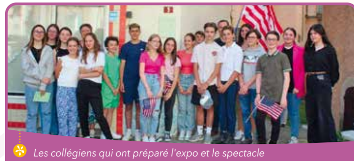
✿ Les collégiens qui ont préparé l'expo et le spectacle

Vingt élèves du collège Vivian Maier de Saint-Bonnet-en-Champsaur, partent ce printemps 2024, aux États-Unis, pour une dizaine de jours, dans le cadre d'un projet organisé par deux de leurs professeurs. Ce sera en Louisiane dans la ville de Gueydan sur les traces de deux frères de St-Bonnet ayant émigré en 1860.