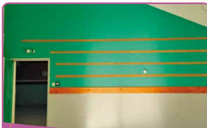
✿ La classe d'Isabelle