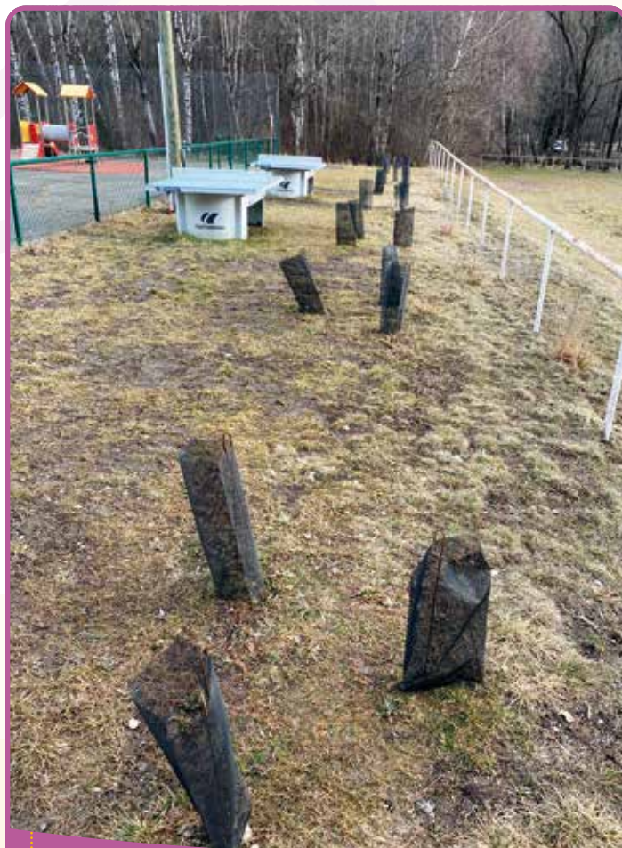
✿☀️ Plantation de bouleaux

vont prendre, malgré les conditions d'un automne particulièrement humide et chahuté !