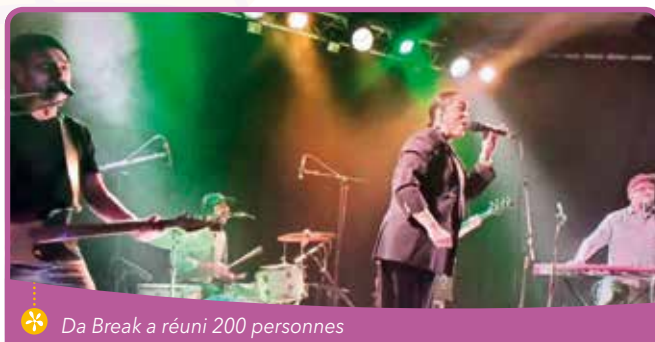
❁ Da Break a réuni 200 personnes