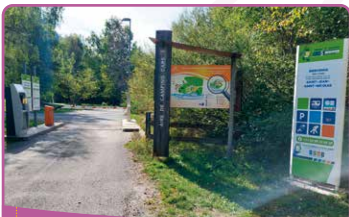
✿ L'aire de camping car

Malheureusement, en fonction des délais des marchés publics, des différentes démarches administratives et du recours de l'ancienne société d'exploitation, la nouvelle aire n'a été opérationnelle que début septembre.