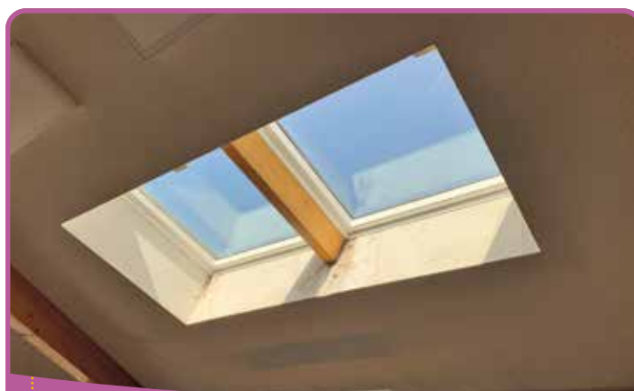
✿ Changement des velux

Les agents du service technique ont également fabriqué des meubles de rangement sur mesure.