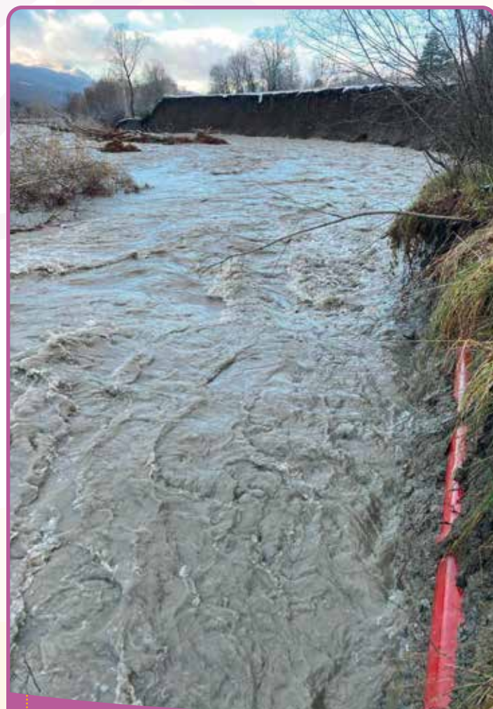
✿ Des crues automnales exceptionnelles

C'est cette crue qui a le plus occasionnée de dégâts sur la commune : inondation des caves dans Pont-du-Fossé par remontée de la nappe, débordement de la source des Fayards dans Montorcier et, sur l'aire de loisirs du Châtelard et destruction de la passerelle des Adous. Les dégâts les plus importants ont concerné le collecteur d'eaux usées au droit de Plein Soleil. Alors que les berges avaient