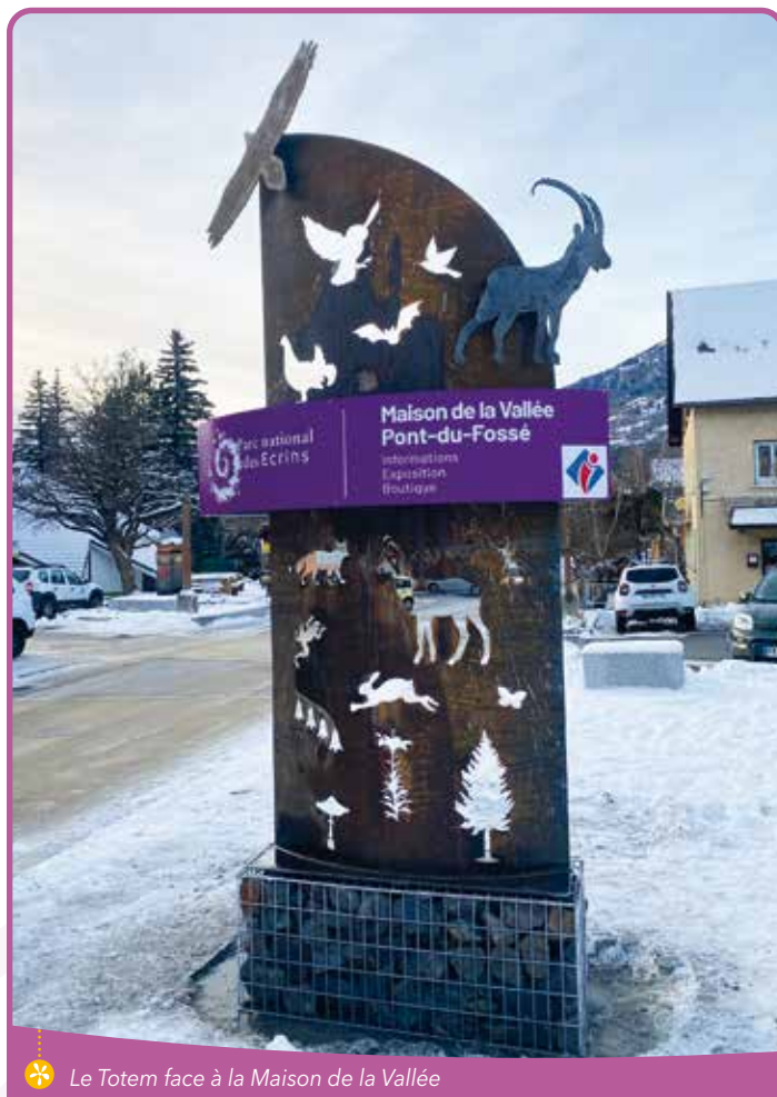
✿ Le Totem face à la Maison de la Vallée

Ainsi, l'accueil touristique et l'information sur le Parc national des Écrins sont modernisés. Saint-Jean-Saint-Nicolas dispose désormais d'un équipement équivalent aux maisons du Parc national présentes dans les autres vallées (Valgaudemar, Vallouise...).