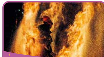
Le spectacle de feu du marché de Noël

Le marché de Noël s'est tenu comme les années précédentes, sur la place centrale de Pont-du-Fossé le 16 décembre 2023, à partir de 14 h par une belle journée ensoleillée. La Fanfare de Noël a permis à toutes et à tous de profiter des nombreuses animations proposées, dans une très agréable ambiance musicale : chasse aux trésors par Hortense Nature, contes de Noël par la médiathèque de la commune et l'arrivée très attendue du Père Noël et de ses friandises.