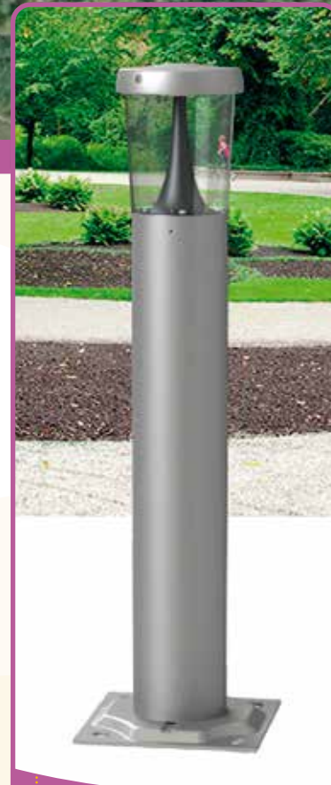
✿ Les 25 bornes lumineuses