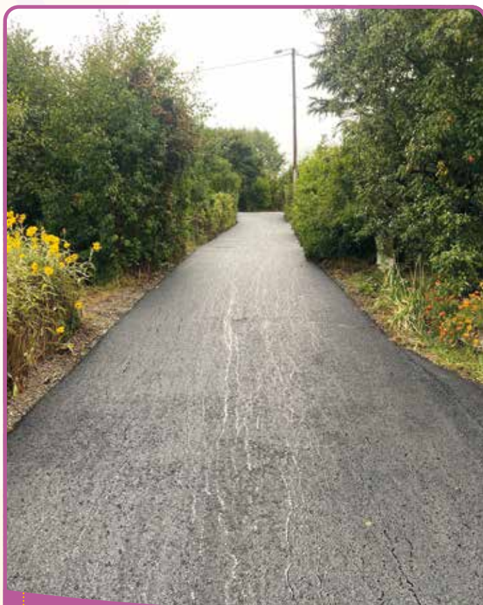
✿ La route du Marais à Chabottonnes

La route de Montorcier, endommagée par les crues de cet automne, va bénéficier d'un financement spécifique.