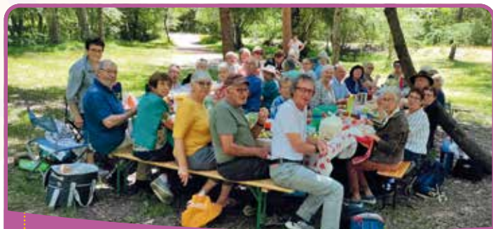
✿ Pique-nique du club Frustelle