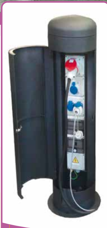
✿ Les 3 bornes festivités

Ce programme a permis également de sécuriser les alimentations électriques lors des événements, l'été et d'économiser la puissance électrique nécessaire à l'éclairage du city stade, du jardin d'enfants et de la paillote, en remplaçant l'éclairage actuel par des LED. Cet éclairage s'éteindra en même temps que l'éclairage public.