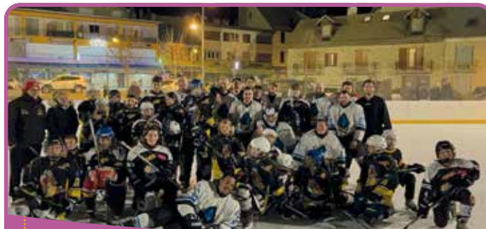
✿ Les Griffes de l'Ours à Pont-du-Fossé

La saison dernière s'est placée sous le signe de la nouveauté pour l'équipe de hockey loisir, Les Griffes de l'Ours. En effet :