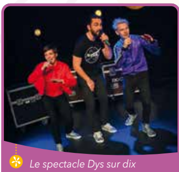
❁ Le spectacle Dys sur dix